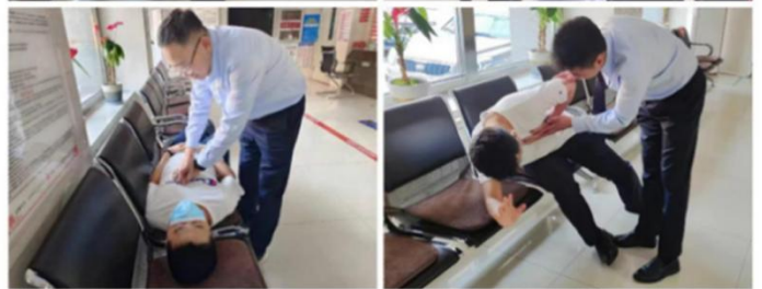
适老化突发疾病演练