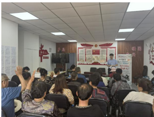
适老化金融知识宣传活动

未来,葫芦岛银行将始终秉承“客户至上 专业服务 致诚致远”的服务理念,不断优化和完善适老化服务举措,为老年客户提供更加优质、便捷的金融服务。