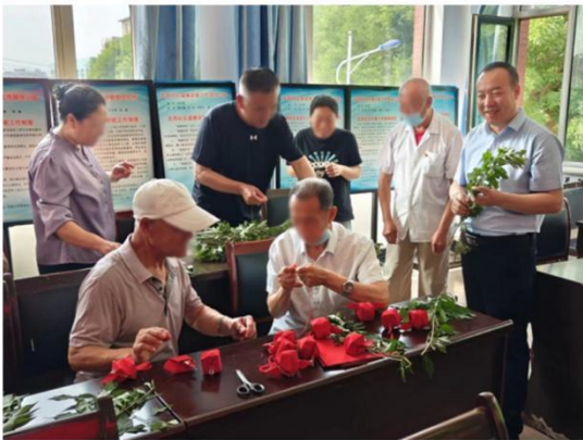
端午节社区敬老活动

除了硬件设施升级外，葫芦岛银行更加注重提升软件服务水平。积极开展适老化金融知识宣传活动，通过宣传册、海报、微信公众号等多种形式向老年客户普及金融知识，提高其金融素养和风险防范意识。同时，还加强了员工培训工作，开展适老化服务场景应急演练，确保员工能够熟练掌握适老化服务知识和必要技能。